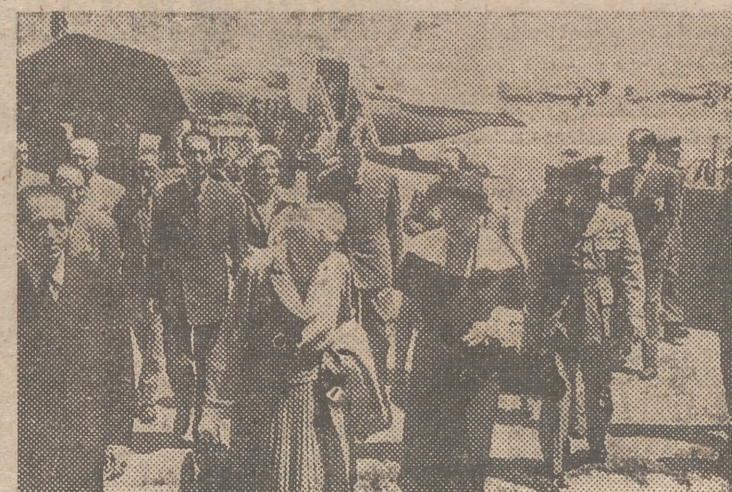
BARAJAS.—Un momento de la llegada de la esposa y la hija del famoso político británico al aeropuerto madrileño, donde fueron recibidas por un representante de la embajada inglesa en Madrid