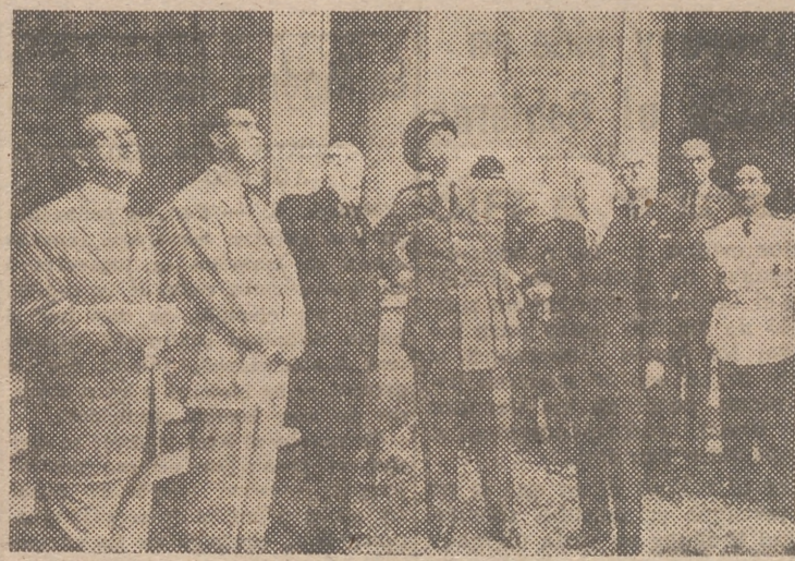
Las autoridades examinan el estado de una de las dependencias del Palacio del Marqués de Dos Aguas

peño tan singular, ya estoy entre vosotros y entrado en el exilio.