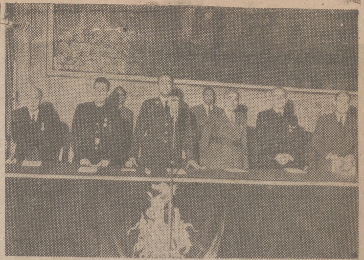
Las autoridades que presidieron el acto del Palacio de la Generalidad escuchan los himnos nacional y de Valencia

"Tanto ha podido en mi ánimo el requerimiento de la Orden de San Juan de Dios, para que con mi presencia y mi palabra contribuyera a esta fiesta en honor de su fundador, que, sin medir mis fuerzas para em-