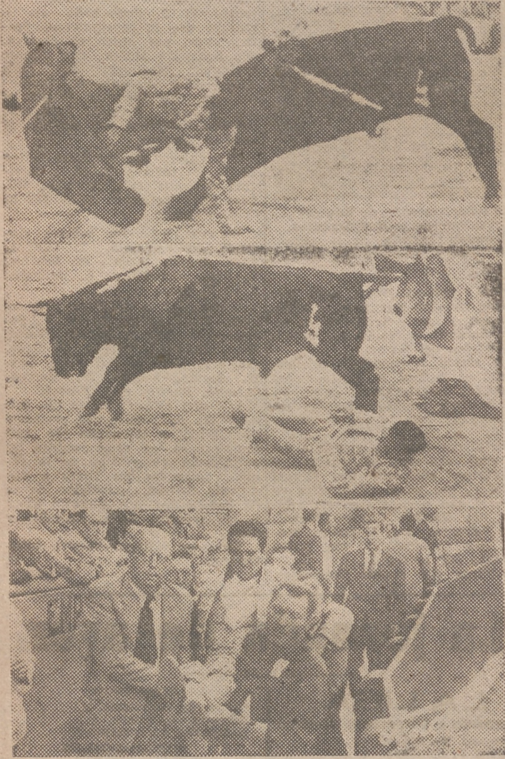
Tres momentos de la cogida de Honrubia por el primero de la tarde

El debutante, Rovira, se las entendió con dos nobles novillos —el tercero y el que cerró plaza— y un manso —el cuarto de la tarde—. Sin entrar en pormenores acerca de la lidia de los respectivos novillos, Rovira se mostró muy entera, sobre todo, si se tiene en cuenta que era ésta la primera covillada con picadores que despachaba. Con capote y mu-