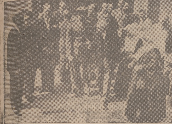
El ministro y sus acompañantes a la salida de la misa que oye en la capilla del Hospital

dedicado al fundador del "Hospital dels Folls de Santa Maria dels Innocents"—en 1409—, Fray Juan Gilaberto Jofré, y al fundador de la Orden Hospitalaria que lleva su nombre, San Juan de Dios, quien consagró su vida al ejercicio de