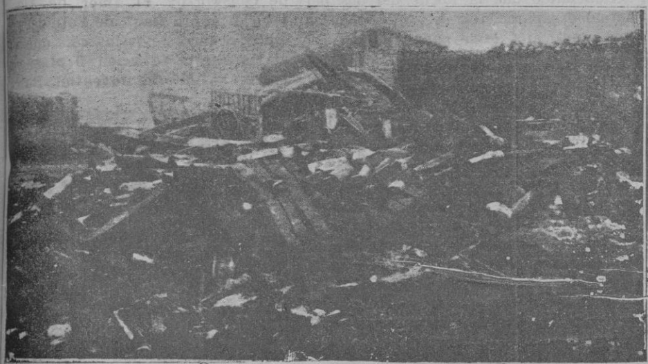
de las calles del pueblo de Fuentes de Valdepero (Palencia) arrasado por una terrible tromba de aire

Si no lo hacemos así no le podremos pagar nunca el haber dejado nuestro pabellón a la altura en que lo ha puesto. BIB