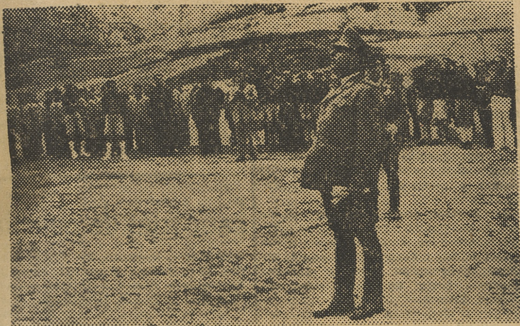
LEON. — El Jefe del Estado se dirige a los cadetes, en la mayoría mineros asturianos, con motivo de su visita al campamento del Frente de Juventudes de Riaño.

Puebla del Caramiñal, 6. — A las ocho de la mañana de ayer fundeó en este puerto el yate «Azor», a bordo del cual viaja Su Excelencia el Jefe del Estado. También fundeó el cañonero «Vasco Núñez de Balboa». El Generalísimo fué cumplimentado por el comandante de Marina de la Puebla del Caramiñal. A pesar de lo inesperado de la visita, la noticia de la presencia del Caudillo circuló rápidamente por toda la villa, cuyas viviendas se engalanaron, echándose a la calle el vecindario, con lo que la Puebla del Caramiñal presentaba un aspecto de gran animación.