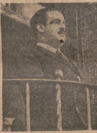
El camarada Girón, ministro de Trabajo, dirige la palabra a los obreros, en el acto de ayer en Sagunto

A continuación se procedió a la entrega de las libretas de Ahorro a los 40 Aprendices seleccionados.