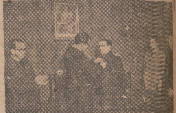
El ministro de Trabajo, impone la encomienda de la orden de Cisneros, al delegado de Trabajo.

A continuación el delegado de Trabajo pronunció unas palabras de agradecimiento por la condecoración que le ha otorgado el Caudillo Franco. Manifiesta su entusiasmo por la doctrina social del Movimiento, a la que consagra todos sus esfuerzos y termina pronunciando las siguientes palabras: