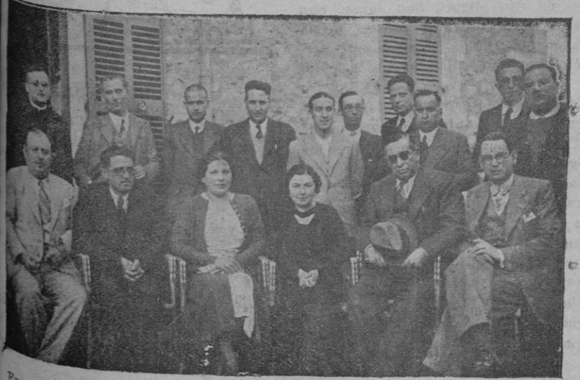
Zacuela Nacional de Avicultura. — El Tribunal de exámenes desig- nado por la Dirección General de Ganadería del Ministerio de Agri- cultura con los peritos avícolas de la promoción 1935

El Alcalde nos manifestó que está dis- puesto a acabar con dicho abuso.