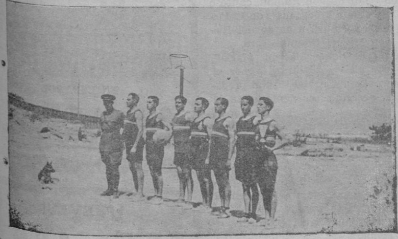
El equipo del Artillería T. M. que ganó la Copa ofrecida por la Federación de Basquetbol, al vencer al Sollerense S. D., con el entrenador del vencedor

LA ALMUDAINA de hoy consta de diez páginas