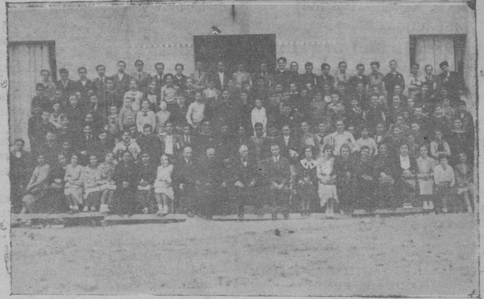
Grupo de alumnos que han tomado parte en los exámenes en el Instituto de Felanitx con su director y profesores