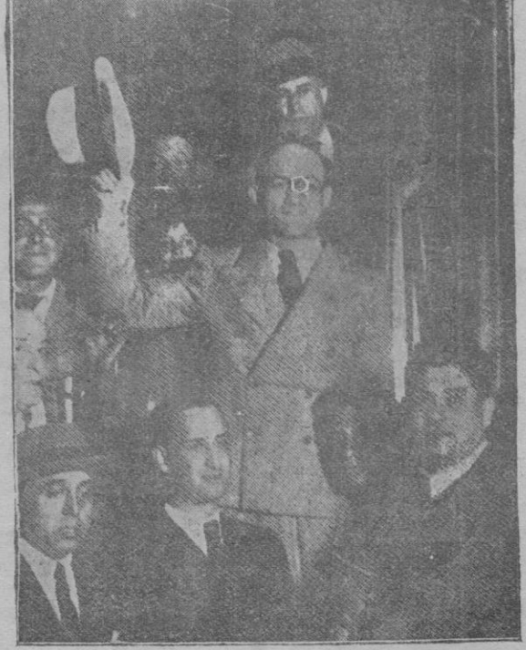
Marcel Thil al llegar a Madrid para disputar con Ignacio Ara el título de campeón mundial del peso medio, cuyo combate debió celebrarse anoche