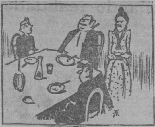
El invitado. — ¡Excelente almuerzo! Hacia mucho tiempo que no comía como hoy. El niño de la casa. — Y nosotros. (De "Gazzetto Illustrato", de Venecia)