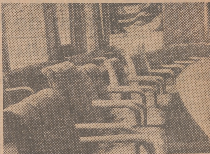
Los suntuosos y confortables sillones de la sala del Consejo de la Sociedad de Naciones, en Ginebra, son limpiados diariamente. Como en espera de unos visitantes, que no volverán ya a ellos