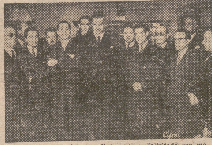
El ministro de Asuntos Exteriores es felicitado con motivo del nuevo año, por los periodistas y fotógrafos que hacen información en su Departamento.