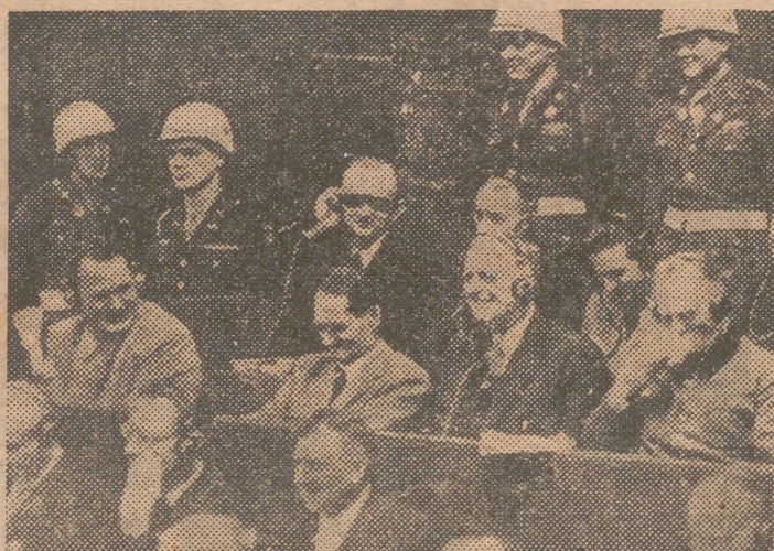
Los acusados muestran su regocijo durante un pasaje de la acusación fiscal

LA PAZ CON HUNGRIA Londres, 29. — Hungría se ha estado preparando para la formación del tratado de paz, según ha