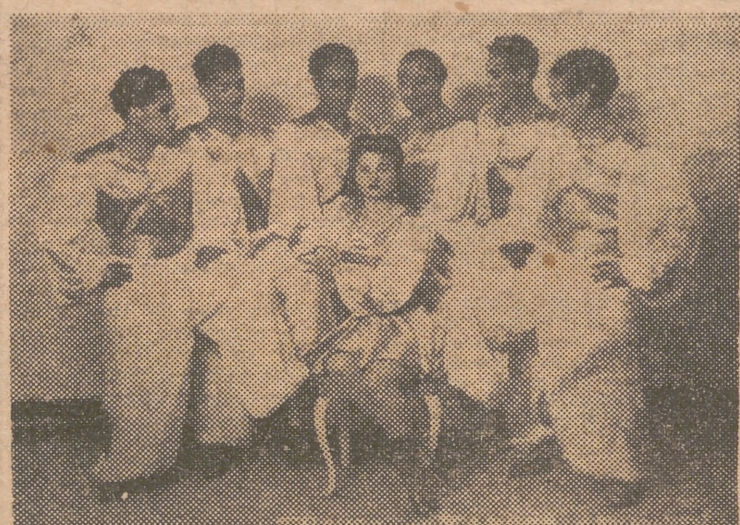
Los 7 Tánger, saltadores formidables y acróbatas de fama mundial

Por el médico de guardia le fueron apreciadas las siguientes lesiones: probable fractura de la sexta costilla izquierda, contusión cara dorsal mano derecha y escoriaciones en la rodilla izquierda. Después de curado fué trasladado a su domicilio.