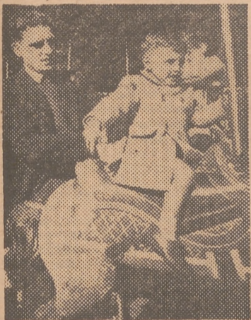
Otro «papá» que, excusándose con los deseos del niño, también sube a la rueda de «caballitos»...