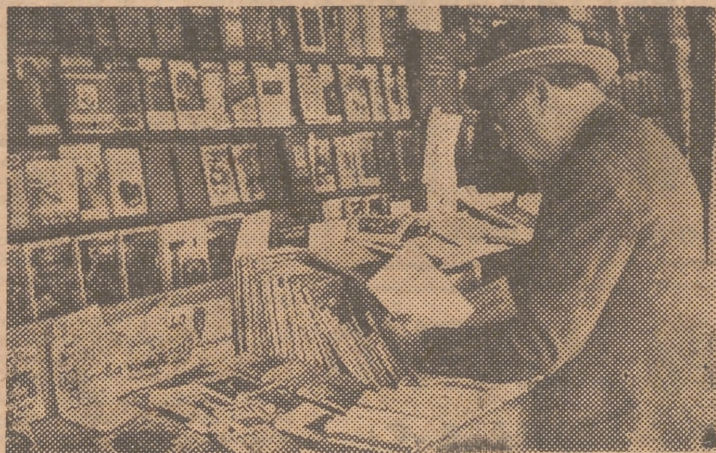
En una librería de lance instalada en la Feria

Muy en breve se celebrará en nuestra ciudad una nueva reunión, de la que saldrá ya designada la junta de mandos de Pax Romana para Valencia.