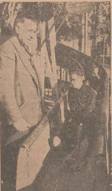
El decano de los feriantes que presentan esta popular atracción

—La gente joven —dice— elige la novela de aventuras; sin embargo —continúa—, son muchísimos los que vienen pregun-