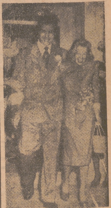
Dick Powell y June Allyson saliendo de la ceremonia de su enlace, entre una lluvia de arroz