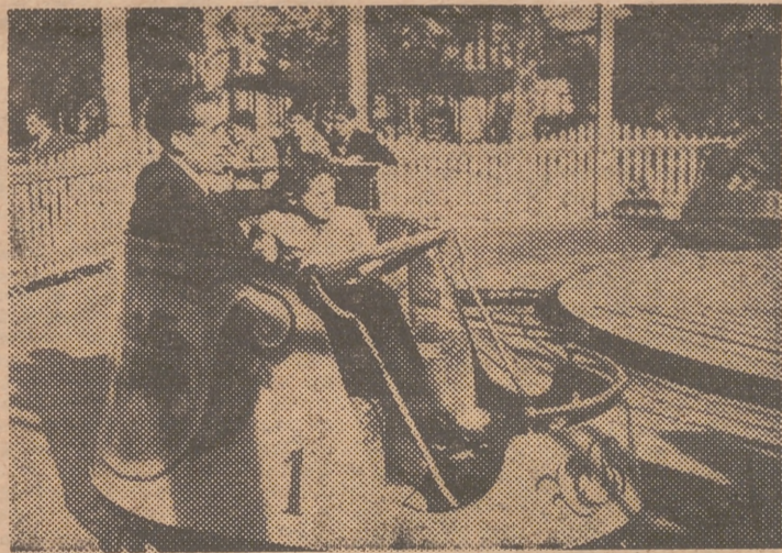
Padre e hijo gozando de las delicias de un «recorrido» en carrousel