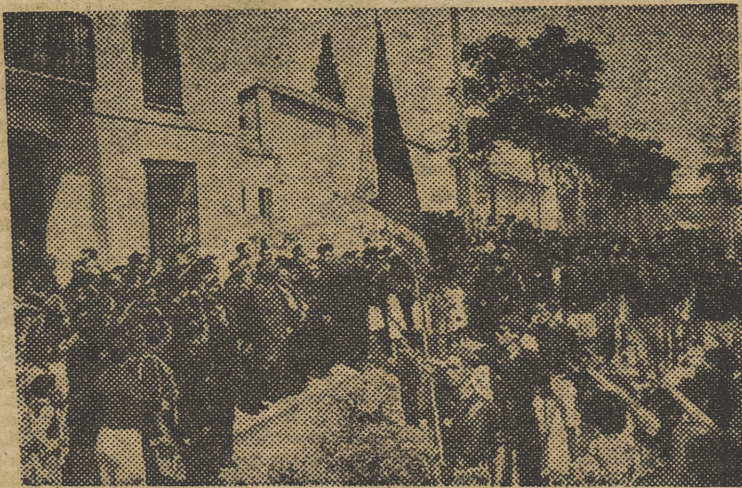
Co. asistencia del jefe provincial y gobernador civil, tuvo lugar ayer, en Paterna, la inauguración del Hogar-Cuartel del Frente de Juventudes «José García Roig» (Información en la quinta página)