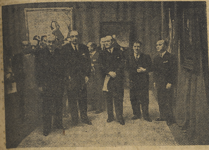
Los ministros de Asuntos Exteriores y de Educación Nacional, acompañados por el director general de Bellas Artes, marqués de Lozoya, y del pintor Sotomayor, visitan la exposición de cuadros de este último en el Museo de Arte Moderno.