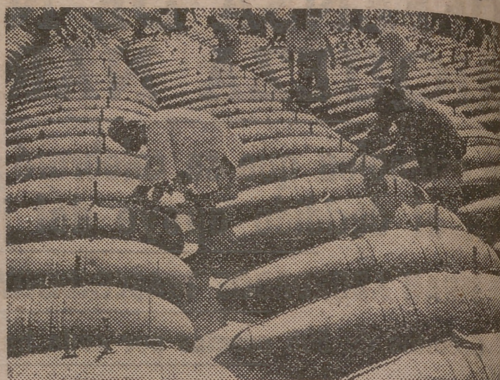
Trabajadores indios inspeccionan largas filas de depósitos de gasolina, destinados a los aviones aliados que operan contra los japoneses desde bases de China e India