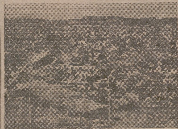
Vista de un antiguo aeródromo de la Luftwaffe, en la localidad alemana de Bad Aibling, que ha sido transformado en campo de concentración para más de ochenta mil prisioneros alemanes.