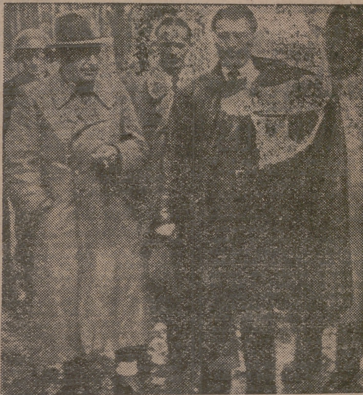
El profesor Von Brick (con el brazo inmovilizado por un aparato para la curación de una fractura), inventor de la «V - 2», en unión de un grupo de hombres de ciencia alemanes, después de su captura por las tropas aliadas.