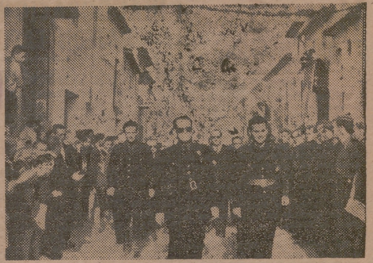
El jefe provincial y gobernador civil, con las autoridades y jerarquías de Turis, a su llegada a dicho pueblo para inaugurar el dispensario que lleva su nombre. (INFORMACION EN LA PAGINA SEGUNDA)

INAUGURACION DEL DISPENSARIO «RAMON LAPORTA», EN TURIS