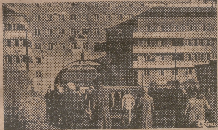
Bloque de viviendas de Carlos Marx, en Viena, bombardeado por la artillería durante la revuelta socialista de 1934.

Al iniciarse la guerra de 1914, Austria y Hungría formaban un solo imperio bajo el reinado de Francisco José. Tenía 52 millones de habitantes sobre una superficie de 624.000 kilómetros cuadrados. El reino austrohúngaro se extendía a Trentino, Bohemia y Moravia, Tirol, Galitzia, Transilvania, Eslovaquia, Croacia, Eslovenia, Bosnia y Dalmacia. Dominaba to-