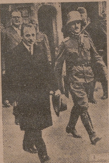
El canciller austriaco Dollfuss, el pequeño gran político que murió asesinado en Viena en 1934, víctima de su política por la independencia de Austria

Schuschnigg sucedió a Dollfuss. Siguió su misma política con el apoyo de Italia, que fué decreciendo cuando la guerra de Abisinia, hasta desaparecer. Se ha-