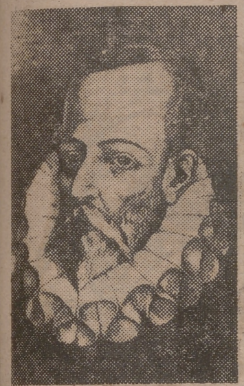
El ingenioso hidalgo don Miguel de Cervantes Saavedra

El pobre cirujano vivía con la buena de su mujer y su numerosa prole, en una humilde man-