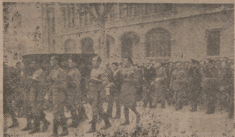
Un momento del entierro del Policía Armada muerto el sábado pasado, en acto de servicio.

Presiden nuestras primeras autoridades civiles y militares