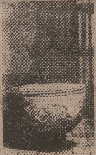
Fuente bautismal de Cervantes, en la iglesia de Santa María, de Alcalá de Henares

Siete años contaba, por tanto el autor del «Quijote» cuando salió de Alcalá de Henares para nunca jamás volver. Siete años es mucha edad en una imaginación tan privilegiada y despierta como la de Cervantes para circunscribir a las cuatro paredes del hogar paterno. El mozalbete, induda-