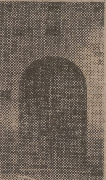
Por esta puerta penetró, en la iglesia de Santa María, el día 9 de octubre de 1547, el cortejo familiar que llevaba a bautizar a Cervantes

sas alamedas del «Chorrillo»; se bañaría en el Henares con otros chicleos de su edad; participaría del jolgorio estudiantil y de las