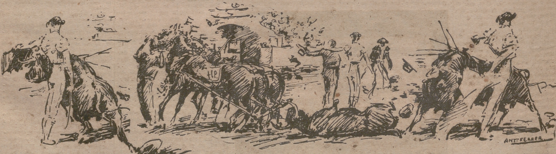
EL TRIUNFO DE ARRUZA