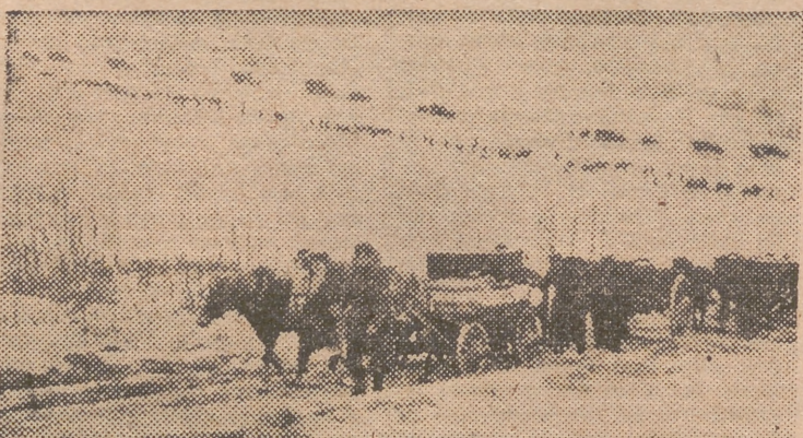
Una columna de abastecimiento alemana, avanza, en el frente del Este, sobre el terreno cubierto por la nieve