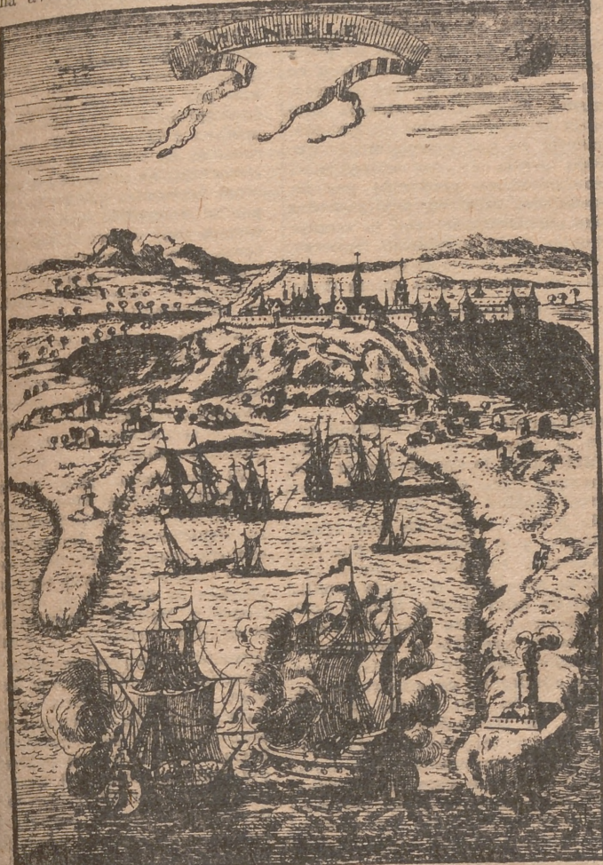
El puerto de Manila en el siglo XVIII