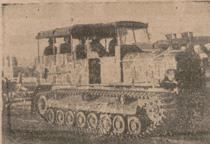
Unidades motorizadas del ejército turco, en un desfile militar después de unas maniobras.