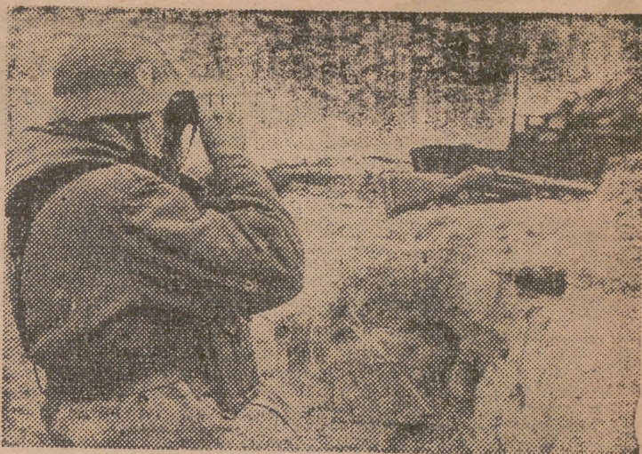
Este observador alemán vigila ininterrumpidamente las posiciones enemigas.