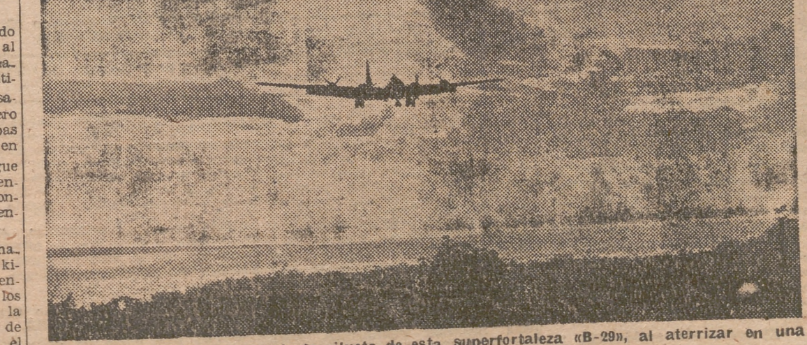
Sobre el sol poniente se dibuja la silueta de esta superfortaleza «B-29», al aterrizar en una base de Saipán, después de cumplida su misión