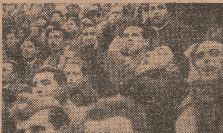
TINTO EN BOTA. — A este aficionado no parece preocuparle demasiado la ola de frío. Y para solemnizar la victoria merengue, empuña la bota, que además, le servirá, sin duda, de calefacción central. Porque la verdad, el hombre va que chuta con la bota.