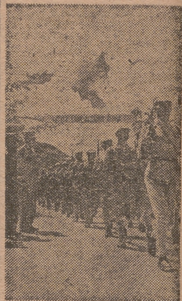
Oficiales chinos y americanos revistan las tropas chinas en un centro de instrucción de Infantería en China