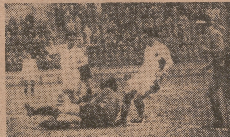
TRIAS. — El guardameta ex españolista y ex internacional, se lanza valientemente a los pies de Mundo que se dirige a la puerta. Y no precisamente con intención de salir. Sino de entrar.