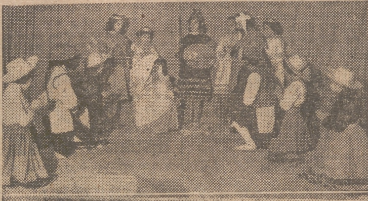
Ayer, por la tarde, en el Hogar «Luis Sansenón», se efectuó una representación de escenas bíblicas a cargo de camaradas de la Sección Femenina del Frente de Juventudes