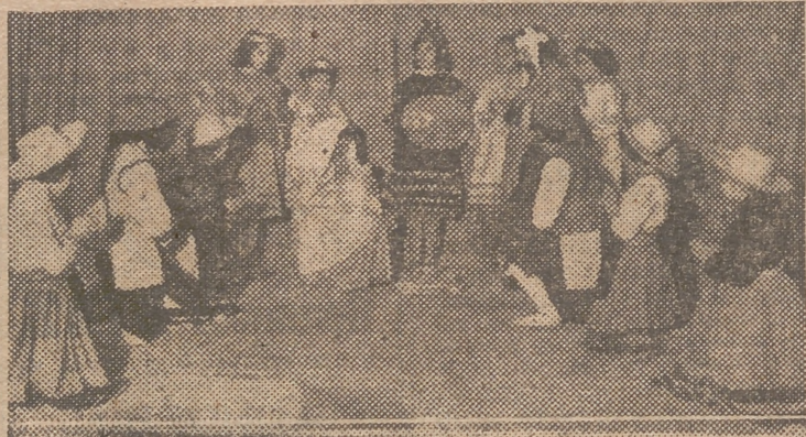
Ayer, por la tarde, en el Hogar «Luis Sansenón», se efectuó una representación de escenas bíblicas a cargo de camaradas de la Sección Femenina del Frente de Juventudes