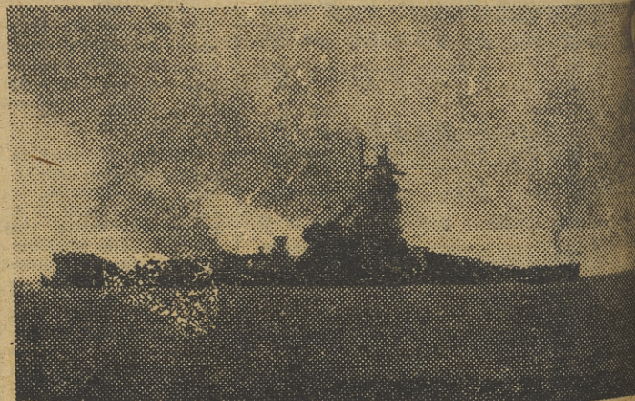
El «Admirante Graf Spee», pocos instantes después de ser echado a pique en una profundidad de 25 pies

En el curso de la guerra han desaparecido por lo menos cuatro de esos nueve acorazados: el «Admiral Graf Spee», hundido el 17 de diciembre de 1939 en el estuario del Río de la Plata; el «Bismarck»,