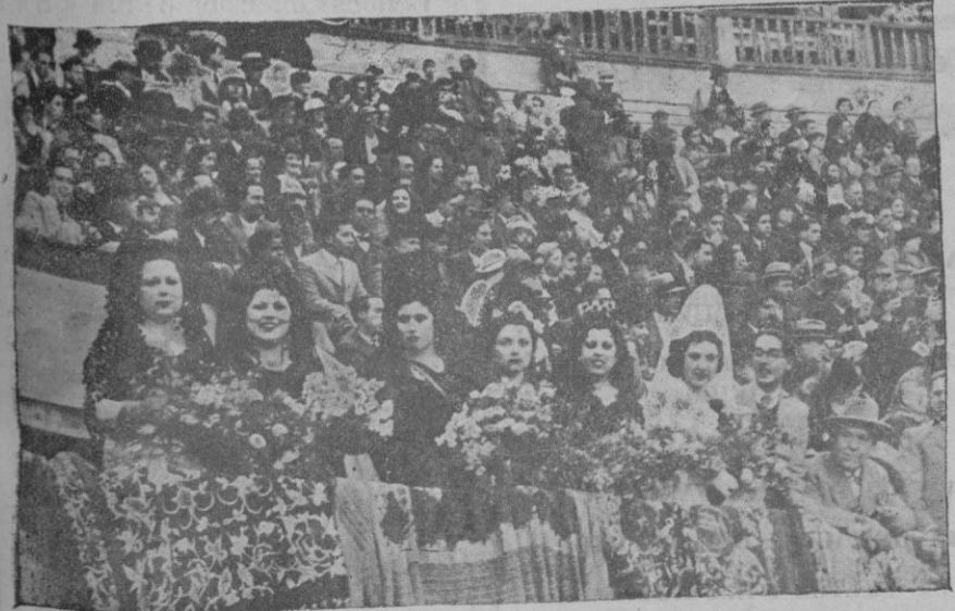
Grupo de señoras que presidieron la corrida

Y fué, realmente, una verdadera lástima por cuanto, los novillos de Carreño, aunque en su mayoría mansurronearan hubieran podido dar bastante juego de haber habido en el ruedo alguien que se sintiera con arrostos suficientes para sentar una bandera. Y si la tarde fué larga en cantidad, también fué pródiga en incidentes desagradables, casi más propios de ser reseñados en una sección de sucesos que en una crónica taurina. Para este cronista es doblemente desagradable tenerlo que hacer constar