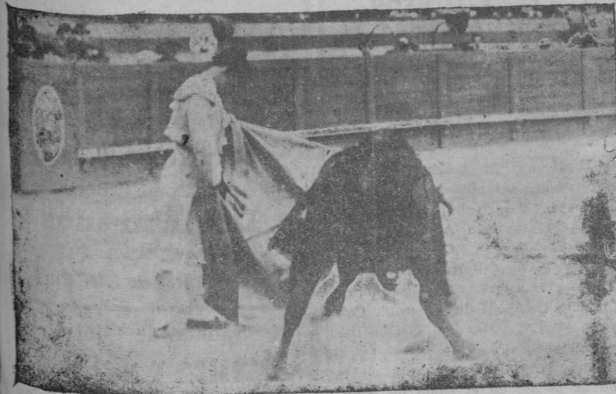
Quinito, lanceando a su primer toro