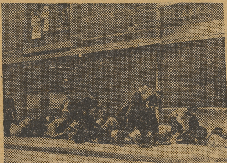
He aquí una de las primeras fotografías directas llegadas a España de la alarma producida en París con los tiroteos desarrollados durante la ceremonia religiosa celebrada en Notre Dame, con asistencia del general De Gaulle, para dar gracias a Dios por la liberación de la capital.