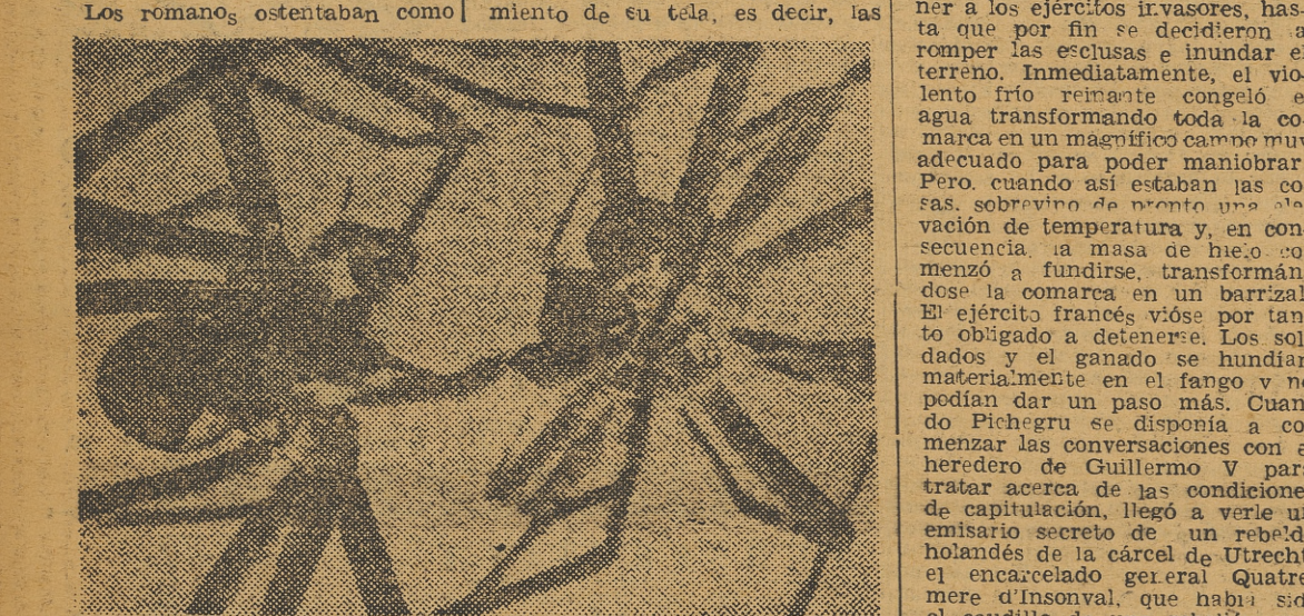
Los romanos ostentaban como amuletos portadores de felicidad arañas de oro, arañas de plata y arañas grabadas en piedras preciosas. Para los musulmanes e incluso en los tiempos actuales, la araña ha sido siempre un insecto sagrado, ya que según la tradición fue una araña la que salvó a Mahoma de sus perseguidores en su huida al tejer una tela en la entrada de la cueva donde el profeta se había refugiado. Los antiguos germanos creían que una casa en la que vive una araña de cruz (asi llamada por la mancha blanca especial que llevan en la espalda) no puede ser alcanzada por el rayo. El signo de Donar (el dios herrero de la mitología germánica) que llevan en el lomo —un martillo— era lo que rechazaba poderosamente la descarga eléctrica. Para los referidos antiguos germanos, todas las arañas en general, animales preferidos por la diosa Freya, eran animales que tan sólo traían la felicidad consigo y combatían las enfermedades. En vano se procuró en la Edad Media dar otra significación a estos arácnidos, de la que surge de los antiguos oráculos paganos. El diablo toma con frecuencia la forma de una araña, o bien, la araña de cruz siempre trae la desgracia, o por último, aquella persona que no quiere que la desdicha le persiga, durante todo el día ha de pisar indefectiblemente todas las arañas que tropiece por la mañana. Sin embargo, el vulgo continuaba aferrado a sus antiguas creencias: Las arañas traen la suerte. Los magos medievales utilizaban que dejando secar las arañas se transformaban a veces en diamantes. Incluso en la actualidad se sigue creyendo que una araña en la corona de azúcar de la novia significa felicidad en el matrimonio. En el campo se les deja vivir libremente y las campesinas hacendosas y amantes de su casa destruyen desde luego las telas de araña, pero colocan las arañas al aire libre, ya que destruir una araña trae la desgracia a la casa. E incluso el hombre ordinario que no cree en las ideas supersticiosas y que vea su vida sin inmutarse en lo más mínimo, no deja, sin embargo, de recordar a veces una araña un

Hay personas que sienten una irresistible atracción por las arañas. Especialmente, las mujeres experimentan un acro instintivo contra estos «bichos feos». ¿Serán quizá las arañas mejores de lo que indica su fama? Por lo menos su utilidad es indiscutible. Hay personas que las protegen, e incluso las mujeres de campo toleran siempre sus nidos; especialmente en los establos y en los marcos de las ventanas durante los meses cálidos del verano, porque son animales que se encargan de eliminar muchas moscas, mosquitos y otros insectos verdaderamente molestos. Desde tiempo inmemorial ha admirado la gente la maestría con que las arañas tejen sus telas y disponen sus redes. Y a poco que se estudie la cuestión, no podemos por menos de asombrarnos de lo mucho que ha influido la araña y su tela en el folklore popular y en los cuentos y leyendas del vulgo.