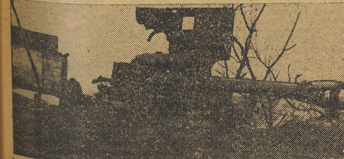
Este cañón soviético ha quedado completamente destruido, en el frente del Este, por el fuego certero de las baterías alemanas.