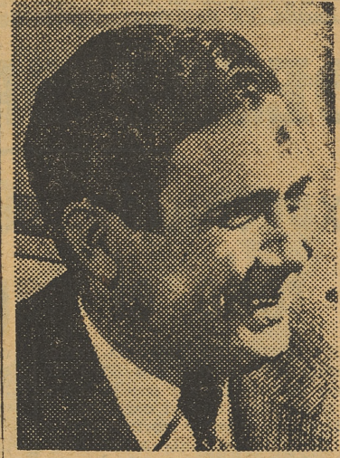
WENDELL L. WILLKIE

En la junta general de accionistas de la productora cinematográfica norteamericana 20 th Century Fox, celebrada en Nueva York el pasado día 17 del actual