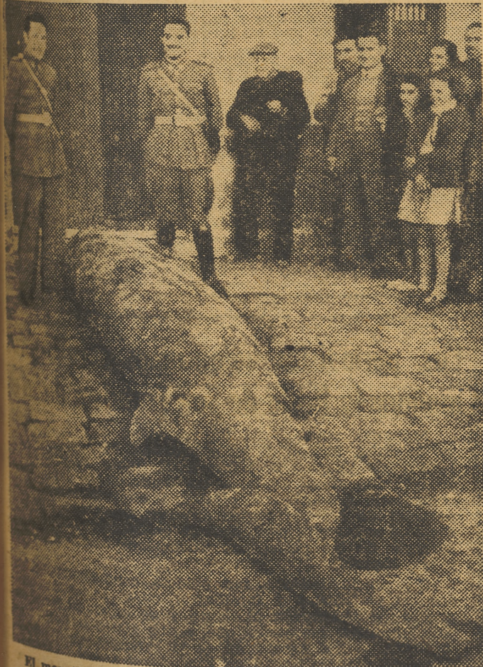
El monstruo marino que ayer fué cazado, a tiros de fusil, en la playa de Pinedo. Mide más de tres metros de longitud y pesa unos 800 kilos

INFORMACION COMPLETA EN LA PAGINA CENTRAL