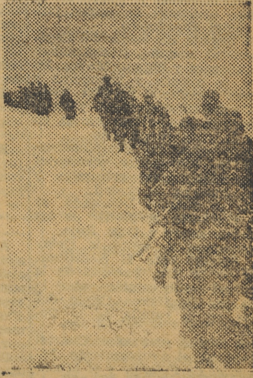
Soldados alemanes se dirigen, a través de las llanuras cubiertas de nieve, a las primeras líneas de combate para relevar a sus camaradas