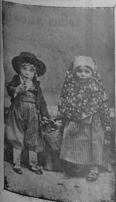
Una pareja de payeses a la antigua. — Niñas Mas