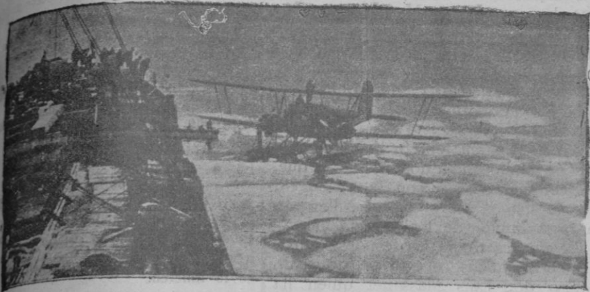
El avión de la flotilla exploradora del almirante Byrd en el Antártico, posándose junto al "Jacob Ruppert"

Camioneta Dogge, 1.000 kgs., a toda prueba. Informes Jaime I, núm. 3, Muro.