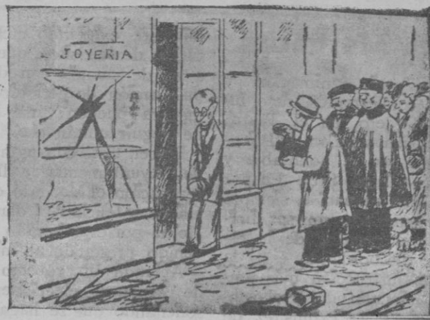
EL SUCESO DEL DIA

El reportero fotógrafo (al joyero robado). — ¡Quieto un segundo y sonrías!