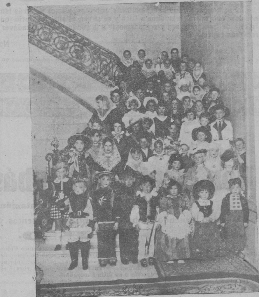
Del baile infantil de trajes celebrado en el Círculo Mallorquín.