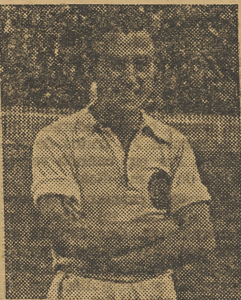
El interior valenciano reaparecerá probablemente en el partido del Sequiol, frente al Castellón, sustituyendo a Hernández.