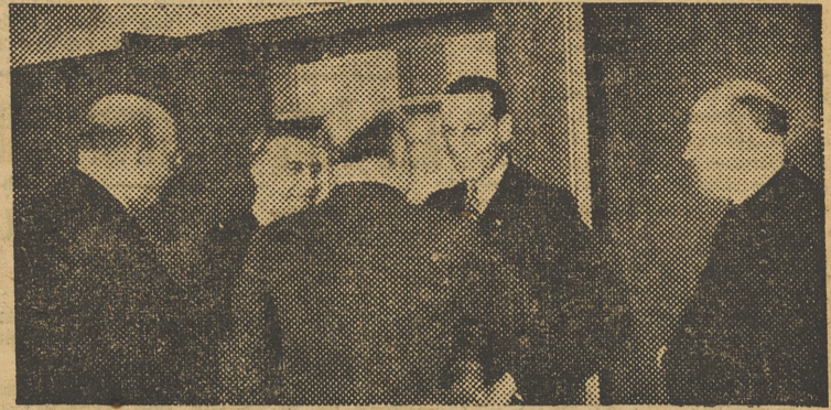
El embajador de Portugal, doctor Teotónio Pereira, visita la Ciudad Universitaria.