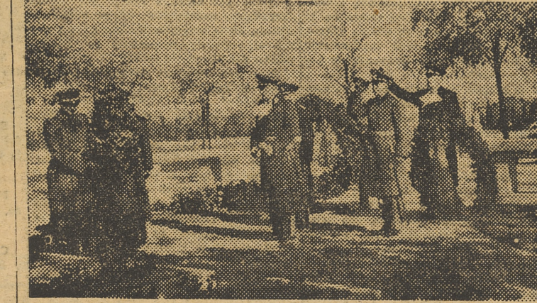
Con motivo de celebrarse en Alemania el «Día de los Caídos», los agregados militares del Reich, en Madrid, depositan, sobre la tumba de los caídos de la «Legión Condor», unas coronas de laurel.