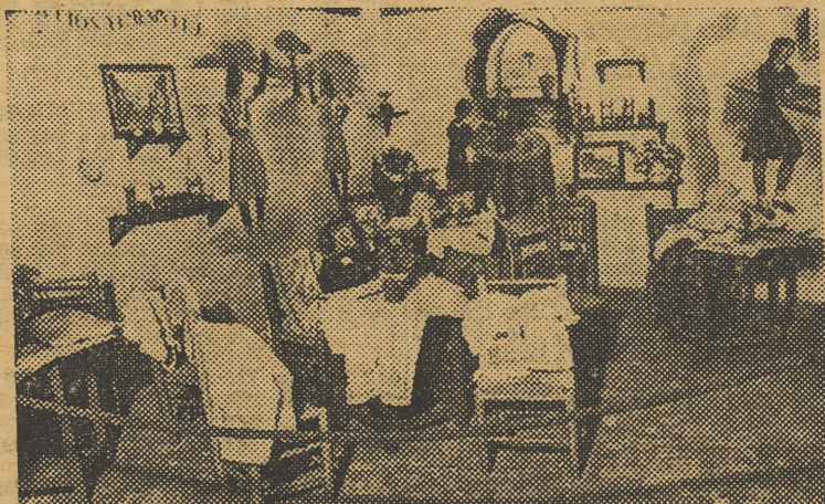
La exposición de labores de la Sección Femenina en el pabellón del Frente de Juventudes.

En el otro «stand», contiguo al descrito, figura una amable y atractiva sala de labor, en la que se admiran trabajos de dibujo, pintura, confección de vestidos, aplicación de encajes, así como elementos culturales para la formación de la mujer tal y como lo exige la hora de España.