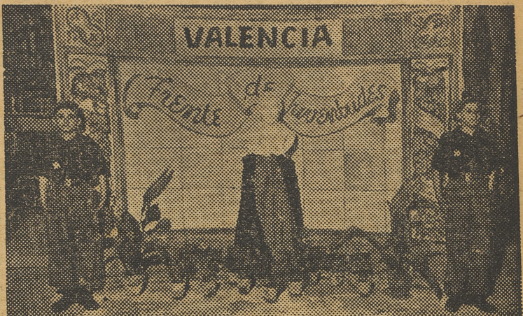
Un busto de José Antonio preside la entrada al pabellón del Frente de Juventudes

rias con la que hace referencia a un día de marcha, al salir del campamento, siguiendo las que interpretan los momentos de izar bandera, formación, lección de Nacional-sindicalismo, ejercicio de educación física y regreso en perfecta formación.