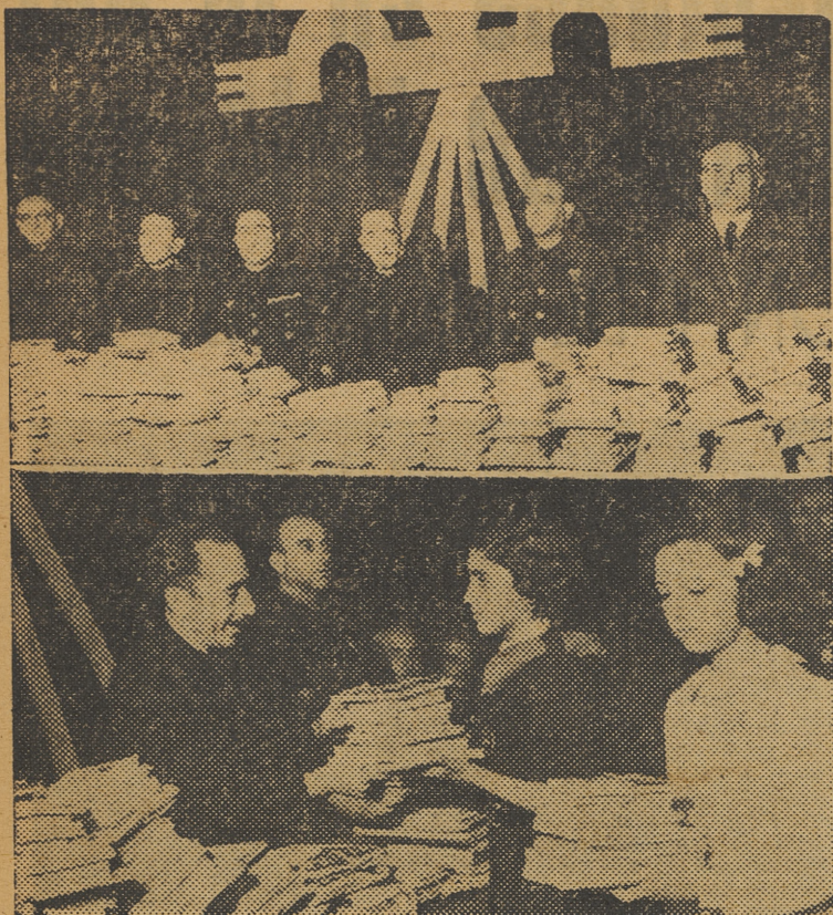
Dos momentos del acto que, organizado por la Delegación Provincial de la Vicesecretaría de Educación Popular, se ha celebrado esta mañana en el Cine Olympia con motivo del reparto de libros a los escolares valencianos