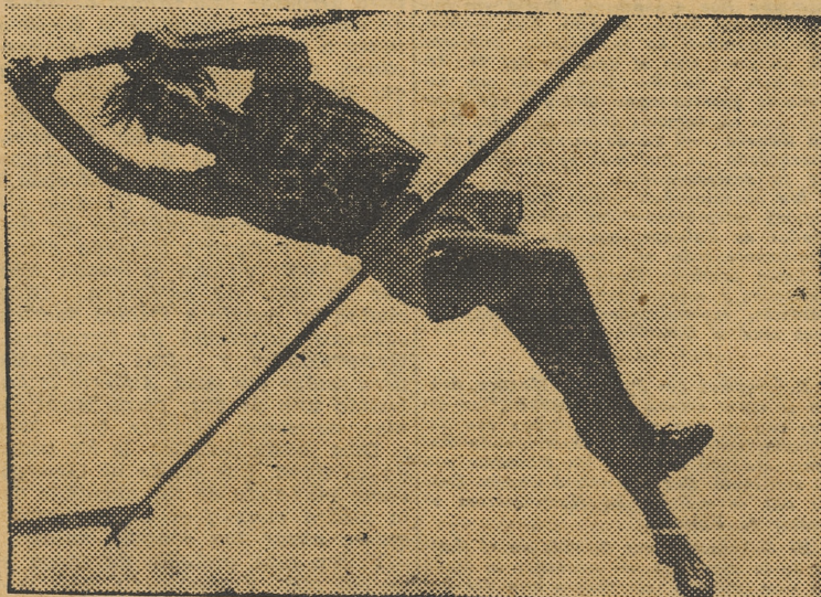
El alemán Gloetzer, ha batido recientemente el record de Europa de salto con pértiga. El citado atleta ha conseguido un salto de 4'60 metros.

Estos anuncios se admiten en la Administración de