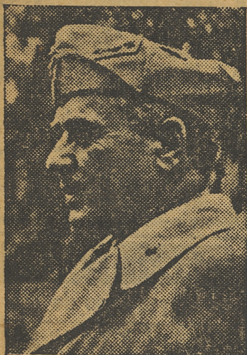
GENERAL MESSE

«En las posiciones del Sur de la península del Cabo Bon, atacada por la espalda por las tro-