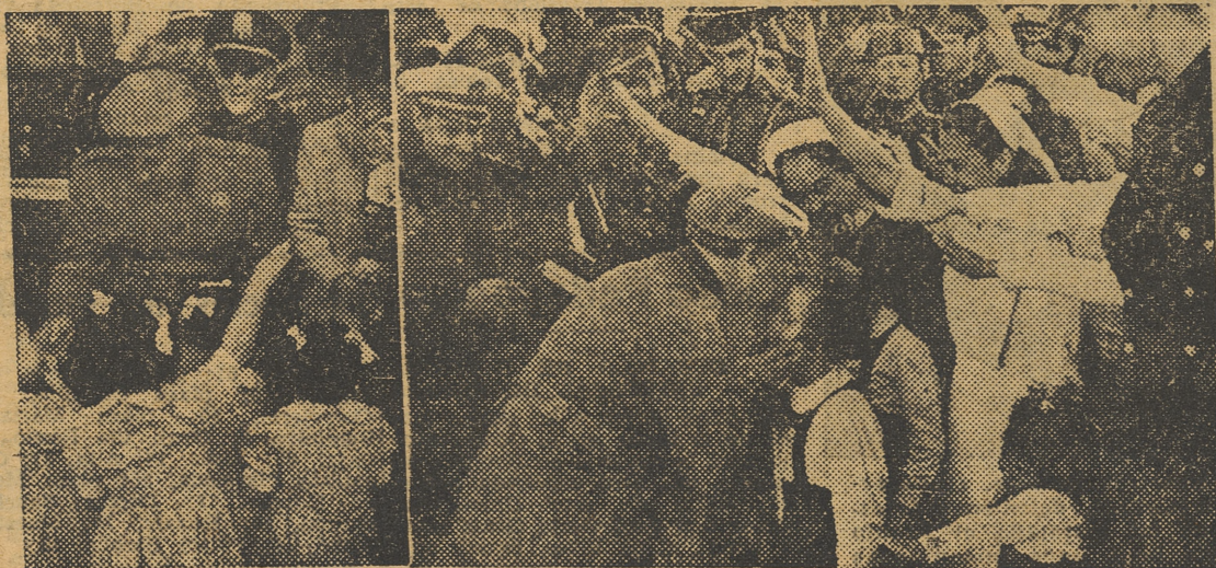
EL CAUDILLO EN GRANADA.—El Caudillo, después de inaugurar el «Hogar José Antonio, de Auxilio Social, conversando con las niñas allí acogidas. — EL CAUDILLO EN ALMERIA.—En la inauguración de unas casas para pescadores, el Caudillo besa efusivamente a las hijas de éstos.