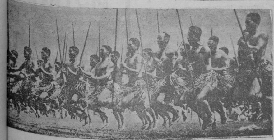
Indígenas de Nueva Zelanda ejecutan, en honor del duque de Gloucester, una típica danza guerrera