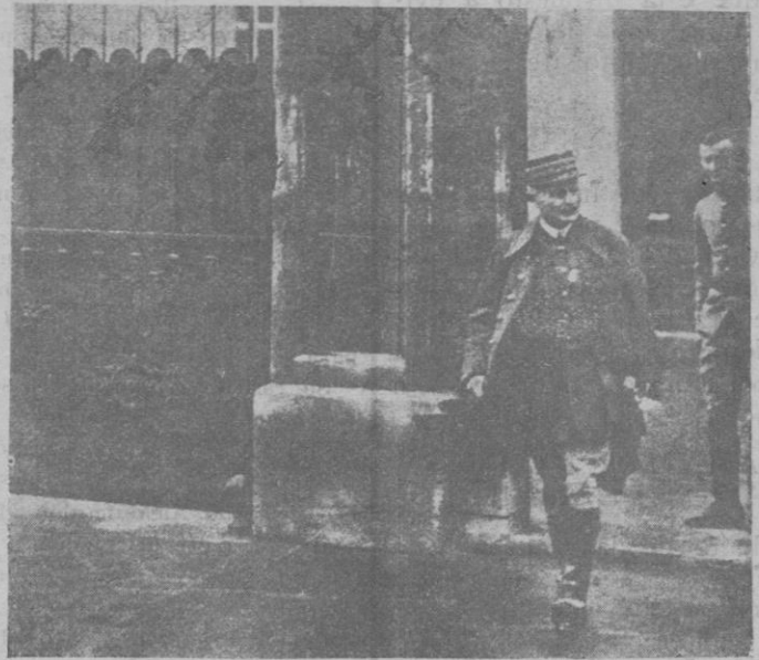
El general Weygand, hasta ahora comandante en jefe de los ejércitos franceses, que ha llegado a Madrid

Se están practicando activas gestiones para el descubrimiento del autor.