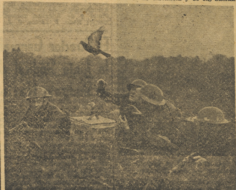
Una patrulla inglesa manda un mensaje por medio de palomas

Los correos alados de la fuerza expedicionaria norteamericana entregaron el 90 por 100 de los mensajes que se les confiaron, en la primera guerra mundial. Hoy, más eficaces que nunca, seguirán prestando servicios allí donde los medios mecánicos corran el riesgo de fracasar.