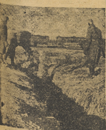
Los alemanes realizan obras para restablecer la producción de Ucrania, el «Granero de Europa»

cristiano mirando al horizonte que señalan sus aguas azules en el Atlántico, y con más veneración, si cabe, aman a la «Madre Patria», palabras que, salidas con fervor de labios de nativos en el Nuevo Mundo, se agigantan al llegar a mis oídos.