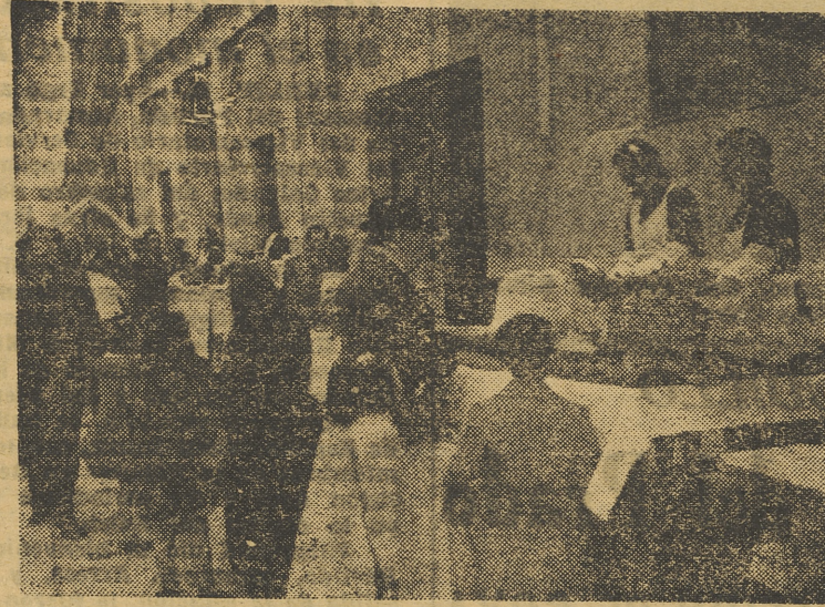
Las clásicas paradas de «Porrats», a la puerta de la iglesia del Santo.