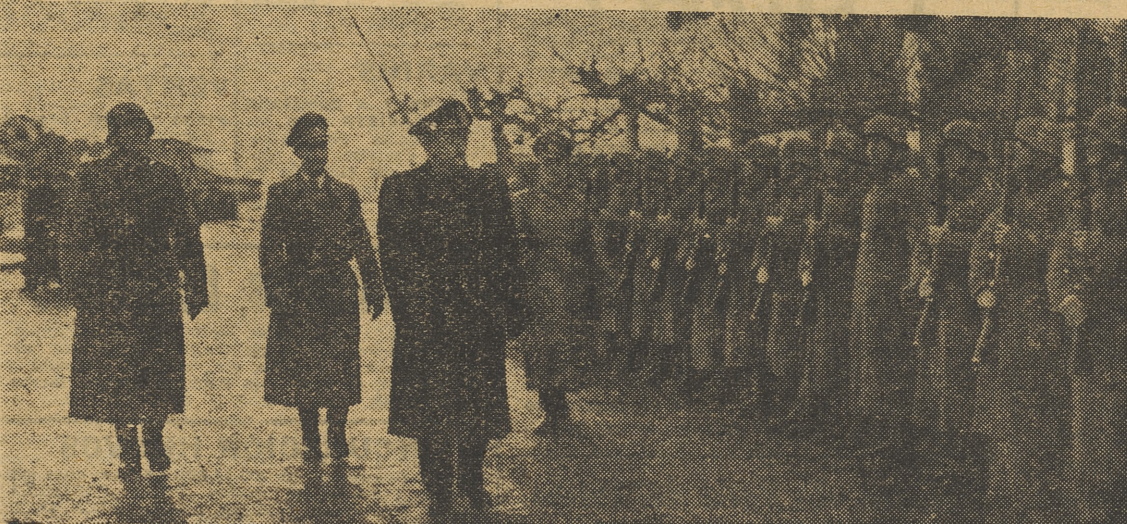
El Ministro Secretario General del Partido, camarada Arrese, pasa revista a las fuerzas alemanas que le rindieron honores a su llegada a territorio francés.