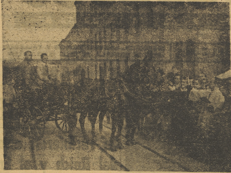
La bendición de los caballos por el capellán de la Iglesia