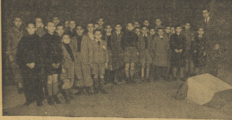
Uno de los grupos de niños que obtuvieron premio en el concurso de villancicos.