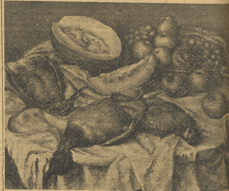
«Bodegón», óleo que expone, entre otras obras, Ramón Ribas Rius en la Sala Prat

Las obras que ahora presenta el pintor catalán Ribas Rius en la Sala Prat, son muestra de un temperamento joven y capaz en plena etapa progresiva. Aun queriendo precavernos contra el natural poder de sugestión que siempre ejerce una pintura no autóctona — y por lo tanto animada por un afán más o menos distinto del que caracteriza a la pintura local —, no podemos eludir una leve sensación de sorpresa, y no desagradable por cierto ante ciertas manifestaciones de la joven pintura catalana.