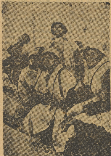
Soldados alemanes siguen con interés el vuelo de los «Stukas» que les traen el aprovisionamiento