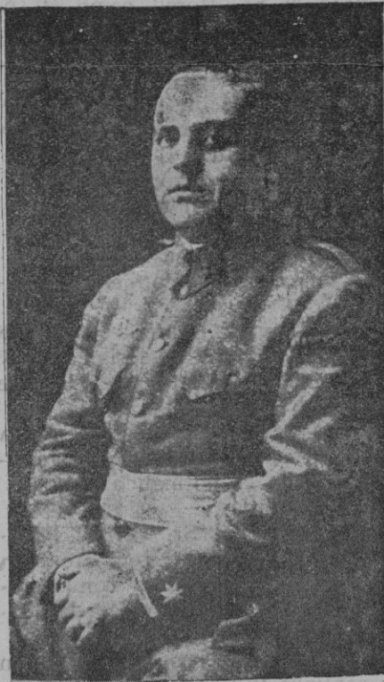
El jefe del E. M. de Gerona, don Rafael Domínguez Otero, muerto por los rebeldes

... cometidos por la chusma contra todo lo que representaba una autoridad. Las órdenes eran siempre las mismas: leñidad, mantenerse a la expectativa, no hacer víctimas aunque ataquen... Así iban tirando el prestigio del uniforme por los suelos, aunque en algunas ocasiones tuvieron que acudir con llamadas urgentes a que estas fuerzas les protegieran de los desmanes que sus propias masas cometían al rebelarse contra muchos de los dirigentes en las contiendas electorales. Pero el uniforme que el Estado español les entregó, es un símbolo y estos fuerzas sabían que tarde o temprano, España volvería a mirar sus ojos de respeto y admiración hacia ellos. Don Alejandro estaba muy seguro de que España iba a continuar su historia gloriosa con el honroso uniforme de sus soldados, sus guardias de asalto, sus guardias civiles, sus carabineros y la oficialidad que encontraba ocasión de manifestar una vez más el espíritu que sintiera cuando se decidió por vestir el uniforme que ha recargado hoy, que ha remozado su autoridad, que la gente lo ve con simpatía por todas partes, y que nosotros queremos elevar en el significado más grande que la nación les señala de ejecutor firme de la Ley, para que sea posible esa continuación histórica que habrá de grabarse por esta vez en letras de oro bordeando la aureola del uniforme militar. Valentín F. CUEVAS