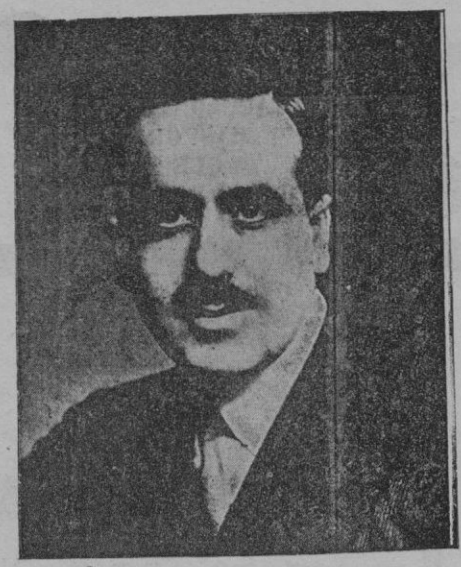
El diputado tradicionalista señor Oreja, asesinado por los revolucionarios

taba, se despojó del abrigo y sacó la petaca, ofreciendo un cigarrillo al oficial que le custodiaba, el cual no fué aceptado. El señor Azaña tomó otro cigarrillo, pero no llegó a encenderlo. El comisario hizo entrega del detenido al auditor, que seguidamente se hizo cargo del señor y lo puso a disposición del oficial del Ejército presente, para su entrega al general Pozas. El oficial dijo al señor Azaña que le siguiera, y el ex jefe del Gobierno así lo hizo, después de despedirse de los presentes diciéndoles: — Adios, señores, ustedes lo pasen bien. El señor Azaña, llevando el abrigo al brazo salió del Cuartel General de la División, desde donde fué conducido al "Ciudad de Cádiz". Durante el camino el señor Azaña se ha mostrado muy satisfecho de las atenciones que se le habían tenido con él y de la amabilidad con que le trataban los agentes encargados de conducirlo al buque, a lo que uno de éstos le contestó: —Don Manuel, además de ser policías somos caballeros".