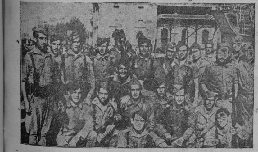
Una bandera del Tercio, al desembarcar en Barcelona

Esta es una versión que hemos recogido en la Barceloneta y que tiene todos los visos de certeza, si se tiene en cuenta que la hora y las señas personales que nos han facilitado coinciden completamente con la hora de la desaparición de dichos jefes rebeldes. EN RIPOLL Ripoll. — Entre los pueblos de Ripoll y Cap de la Nou ocurrieron ayer graves sucesos, de los que han resultado tres víctimas. Caminaban con dirección a este último pueblo varios números del cuerpo de Carabineros, cuando al hallarse aproximadamente en la mitad del recorrido que separa ambos pueblos, fueron agredidos por un grupo de revoltosos, que les hicieron algunos disparos. Los carabineros repelieron seguidamente la agresión, estableciéndose un intenso tiroteo, del cual resultaron tres individuos de los rebeldes muertos, ignorándose de momento los nombres. En los pueblos anteriormente citados reina por ahora absoluta tranquilidad. LA NUEVA LEY PENANDA LOS DELITOS COMETIDOS POR MEDIO DE EXPLOSIVOS, ROBO A MANO ARMADA Y SIMILARES. — SE ESTABLECE LA PENA DE MUERTE La ley de represión de los delitos cometidos utilizando explosivos u otros medios (Sigue en 4.ª página)