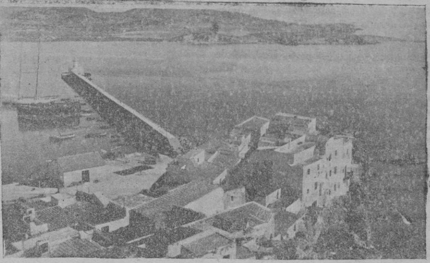
"Sa Penya" barrio típico de Ibiza. Encierra un secreto su luz y su blancura.

Y es precisamente aquí—en lo alto de este acantilado atrevido que se encabrita en un retorcimiento hercúleo como si su esfuerzo retuviera a la ciudad de caer y hundirse en el obscuro azul del mar—entre estas rocas y estas crías blanquitas del barrio típico de "Sa Penya" el lugar que más invita a la evocación de épocas de epepeya. Mirando al mar hacia lo lejos, donde no se vé nada, de cara a Fenicia y a Cartago, parece que han de aparecer sobre el horizonte, impulsados levemente por la vagaboga de los esclavos, los bajeles toscos de aquellos pueblos mercaderes. Y desde el mar, sobre la línea del horizonte, la ciudad de Ibiza—currucho blanco—ofrece un ritmo de ciudad árabe igual