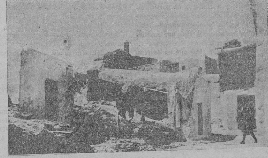
Peñas y casas blancas de una torturada calle del barrio de "Sa Penya".

al de cualquier urbe de más allá del Mediterráneo. "Sa Penya" en el amontonamiento de casas blancas ofrece el suyo—de carácter personal—encantadoramente desgarrado. En las entrañas del barrio, entre el laberinto de paredes blancas, el viajero observa la supervivencia de unas construcciones viejitas, correspondientes a un concepto muy antiguo del urbanismo—concepto árabe—que contrastan con la vida y la indumentaria de las gentes que lo habitan. Es una pugna del ambiente y del hombre que tiene un aspecto pintoresco y muy interesante. Las calles estrechas, zigzagantes hasta la