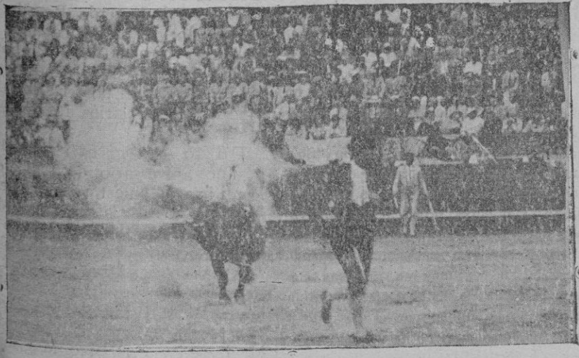
De la corrida del domingo. — El fogueo del primer toro.