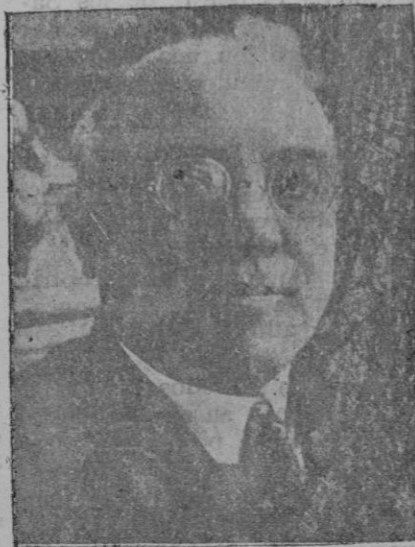
El ministro francés del Interior, M. Albert Sarraut. — M. Albert Sarraut, ministro francés del Interior, que estos días es huésped de Mallorca, pasando una temporada en Formentor