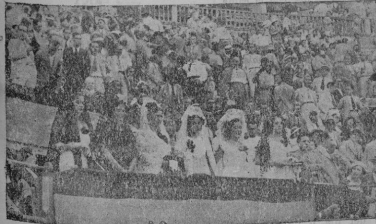
Las bellas señoritas que formaban la presidencia de honor en la corri- da celebrada el domingo a beneficio de la Asociación de la Prensa

"Melonero" se llamaba el de Casal que abrió la plaza. Colorado. Una catedral. Me- jor dicho: un hipopotamo que desde las pri- meras de cambio se convirtió en buey de carreta. Manso. Mansísimo. ¡Vaya regalo, Marcial! Al mismo paso que salió—el de tortuga—hizo toda la brega. Fijo en los medios y... ¡ahí me las den todas! Casi no logran sacarle de su sopor los cuatro pares de fuegos de arteificio. Naturalmente, la lidia es de una sosería espantosa. Mar- cial, muy habilidoso, llegado al último ter- cio, le proporciona un intento de estoconazo y acaba con el Melonero" de media estoca- da, a paso de banderillas. ¿A quien se le ocurre mandar un "Melonero" para ser li-