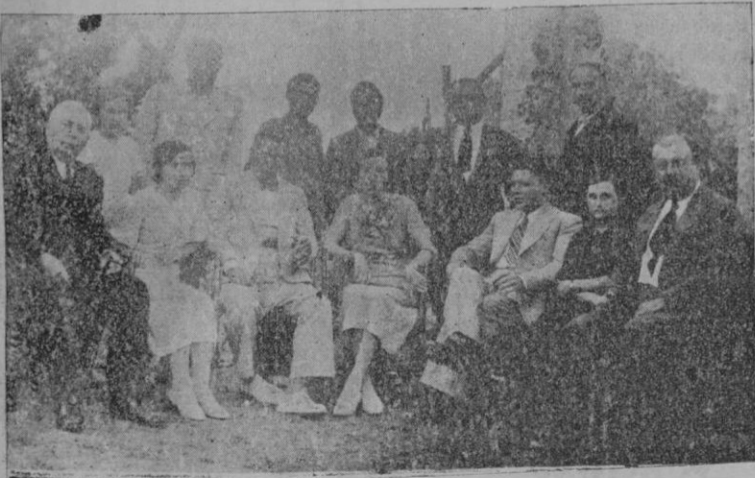
Escuela Nacional de Avicultura. — Los "Peritos Avícolas" de la promoción de 1934 con el Tribunal de Exámenes designado por la Dirección General de Ganadería.