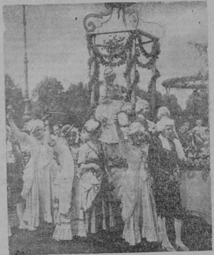
En Berlin se ha celebrado con gran pompa la Fiesta de la rosa. — La reina de las rosas paseada por las calles, con su corte de damas y caballeros.

Fue designado el diputado señor Amer, en representación de la Comisión Gestora, para formar parte de la mesa de la sub-