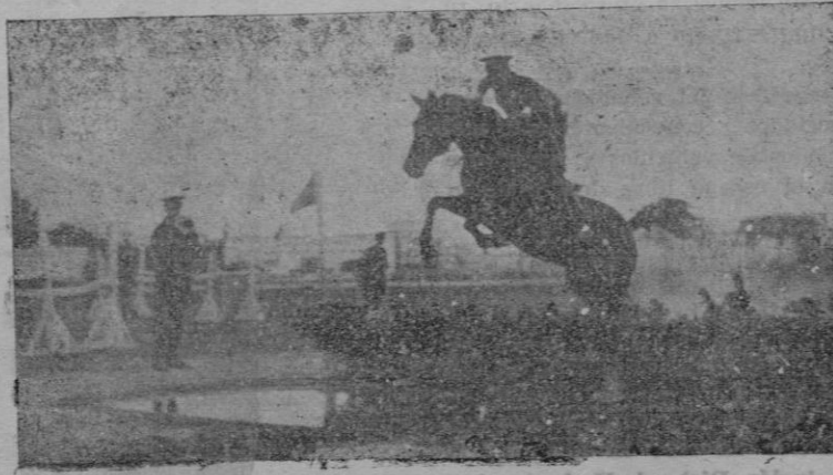
Un detalle de la función inaugural del Concurso Hípico.

El señor Fiscal acusaba al procesado de que el día 19 de diciembre de 1933, estando hospedado en una fonda de la calle de la Herrería de esta capital, se apoderó de