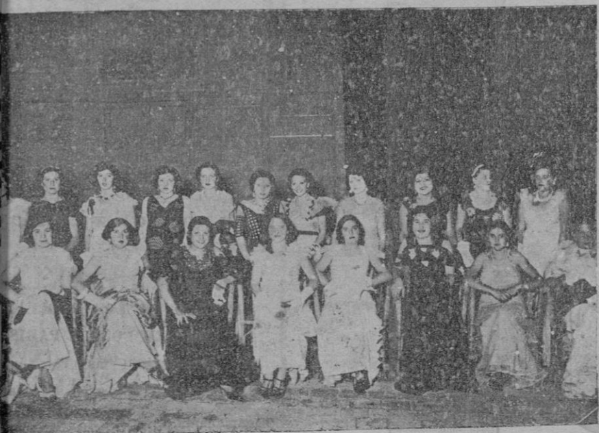
Un grupo de señoritas que tomaron parte en el Concurso del Vestido de cinco pesetas, celebrado el domingo en el Club Español.

Así lo verificamos y damos por terminada nuestra misión y las gracias a todos los que han contribuido a la realización de nuestro fin.