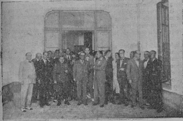
Autoridades e invitados a la inauguración del nuevo dispensario de la Casa Consistorial

Al paso de la comitiva por las calles, el público colocado en apiñadas filas aplaudía sin cesar.