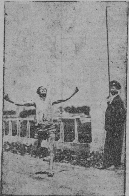
El vencedor de la carrera pedestre de 3.000 m., celebrada el pasado domingo

Para las voces humanas suelen juntarse en el estudio no solamente todos los artistas que doblan la misma película, sino tam-