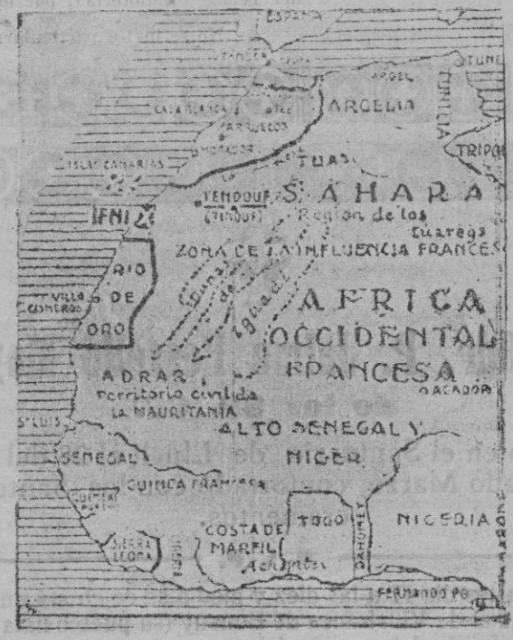
Plano de Ifni y su Zona, con las posesiones españolas