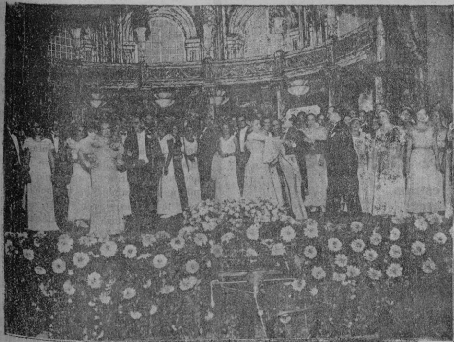
«El grupo amateur del arte lírico» que anoche se presentó en el Teatro Principal con brillante éxito, y que esta noche hace su segunda y última presentación poniendo en escena «El Conde de Luxemburgo»