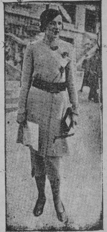
Una modelo con traje de primavera, presentado en París

No es muy esperanzador en este sentido el discurso pronunciado por el señor Domingo en la Asamblea final del partido radical socialista. El ex-ministro de Agricultura insiste excesivamente en el pasado. De nada tenemos que arrepentirnos, decía a sus correligionarios. Por el contrario, hemos de proseguir—agregaba—aquella política sin rectificación ninguna. Y volvía a surgir en sus palabras el tema revolucionario y a alianza con los socialistas. Para nosotros, en cambio, el mejor camino sería que los directores del nuevo partido meditasen un punto sobre las causas de su descaecimiento y viesan si entre ellos no figuran también algunos errores propios. Lo peor que puede ocurrirle al vencido no es la derrota, sino atribuirle íntegra y exclusivamente a causas ajenas y exteriores a él. Así, sucede que el señor Domingo y su partido, a juzgar por su discurso, entran en el nuevo a proseguir la política pretérita, y aún más, a intensificarla. Supone el Sr. Domingo que, si han sido vencidos, no se debe a la política practicada, sino a no haberla llevado a sus lí-