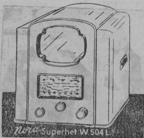
Nora Superhet W.504 L