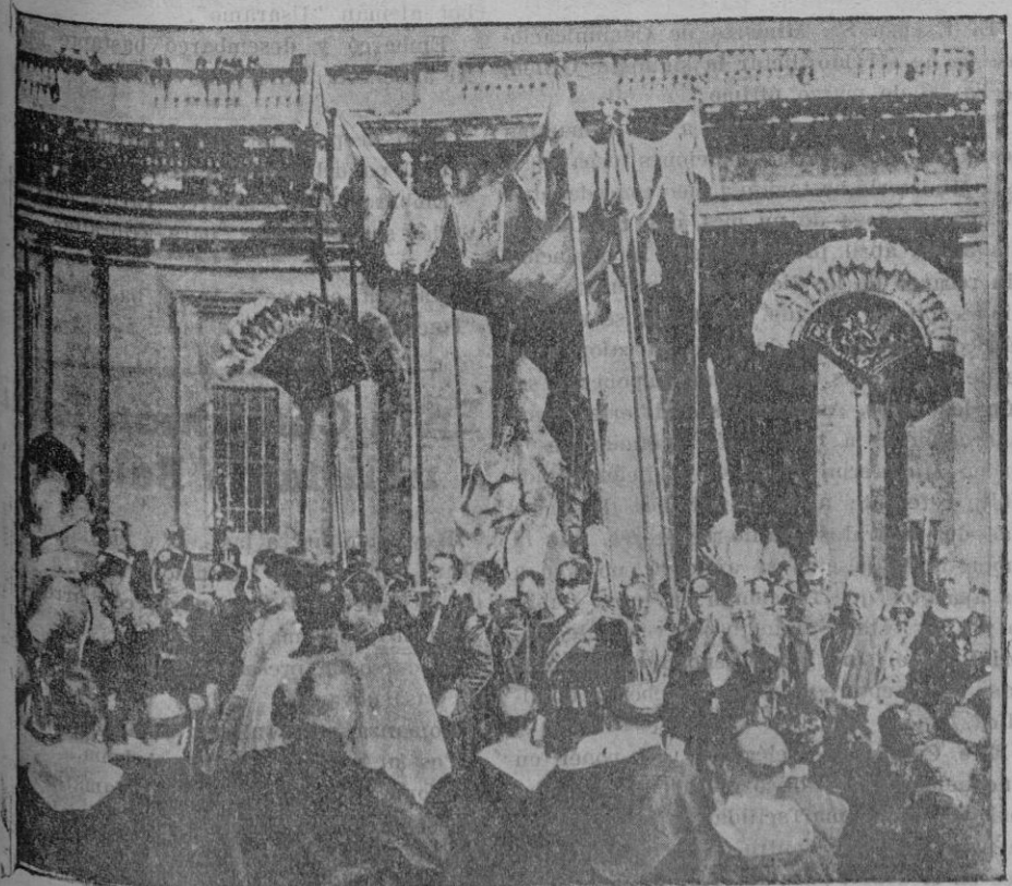
Roma.—La ceremonia de clausura del Año Santo alcanzó una magnificencia y una solemnidad extraordinarias. El soberano Pontífice, bendiciendo desde la silla gestatoria, a los fieles, que en número de sesenta mil se reunieron en la plaza de San Pedro.

LA ALMUDAINA de hoy consta de doce páginas