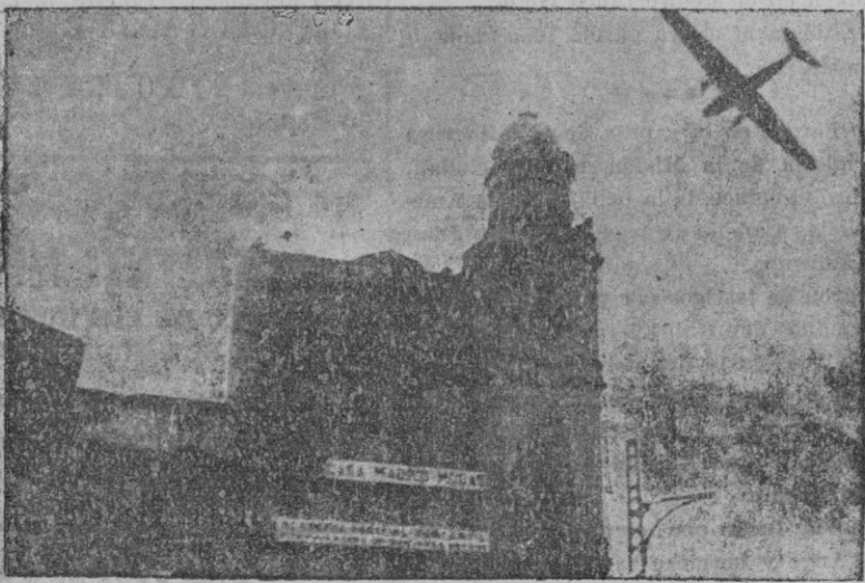
Zaragoza.—Un avión volando sobre la ciudad para inspeccionar los tejados desde donde los revolucionarios atacaba a la fuerza pública