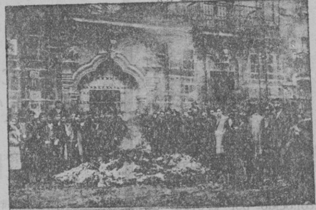
Brunos.—El público contemplando los restos de la hoguera del archivo municipal incendiado por los revolucionarios