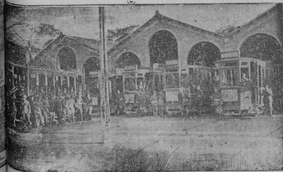
Fasada huelga—Soldados de Ingenieros y de Artillería en las cocheras de tranvías preparados para salir a prestar servicio