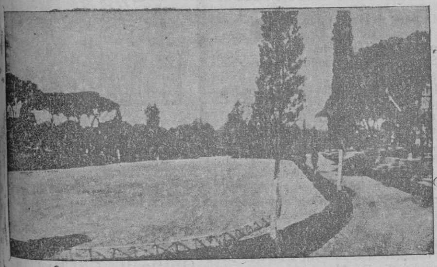
La Piazza di Siena, de la Villa Borghese, en donde tendrá efecto el encuentro mañana domingo, de Primo Carnera con Uzcudun

I l'ardorós monarca, incurós del seu fosc destí, radiant com la reina de la nit abans que l'eclipsi l'emboicall en el mantell de fonda tristor, passava baix de l'arcada, per on eixia a la plaça nova (avui de Santa Eulàlia) i seguia la via pel carrer de Mossèn Morey, al cap del qual girava el corteig imperial per la "volta enderrocada de Mossen Aulesa de Vinagrella", deixalla aràbiga que es pontava ran de la creu que el vianant troba encara al carrer de Sant Pere Nolasc, després tombava a mà dreta pel de Mossèn Miquel Sureda Zanglada, el qual