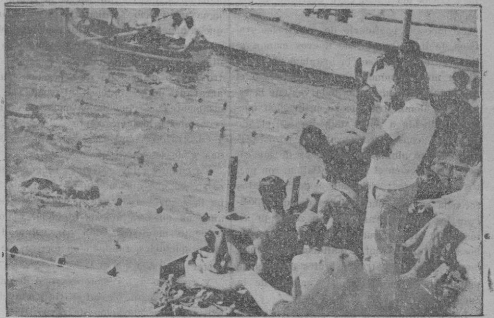
Del campeonato de natación.—En plena prueba.