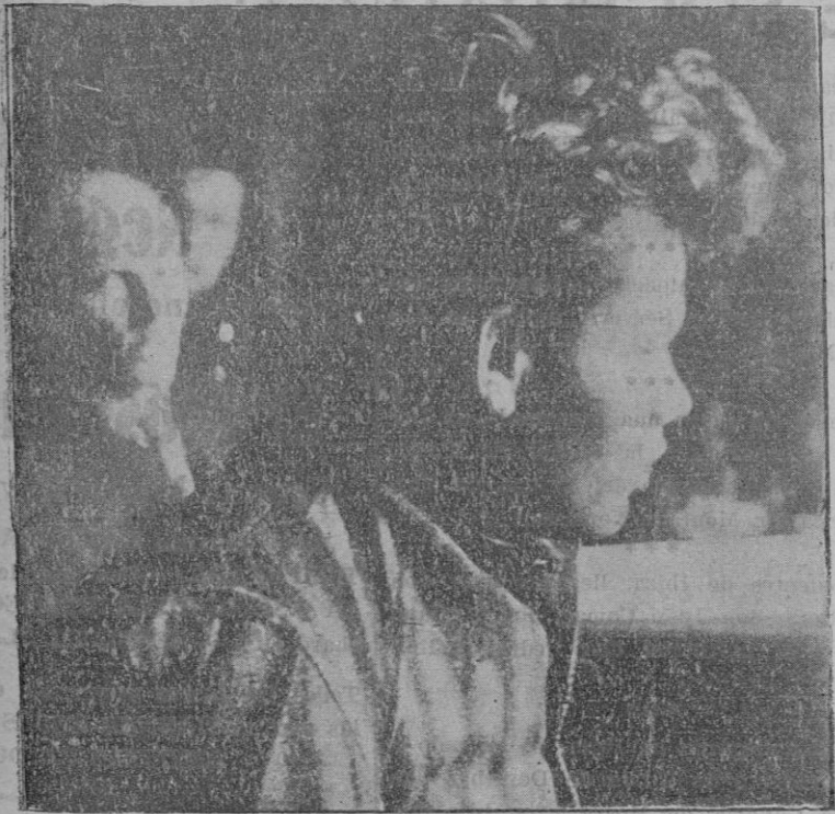
Del incendio del Reichstag.—El principal procesado Van der Lubbe

Tomando como base el cálculo de 50 litros por día y habitante y asignando a la zona a que ha de alcanzar el servicio una población de 60.000 habitantes, resulta un gasto diario de 3.000 metros cúbicos; cantidad que el manantial da incluso en la época de estiaje, ya que la estadística de 14 años de observaciones, que se conserva en el Negociado de Aguas, demuestra que en siete de estos catorce años, no ha habido ningún día de menor rendimiento de dichos 3.000 metros cúbicos, y en los restantes años han