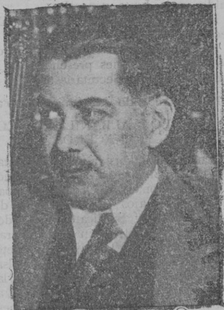
El nuevo ministro de Obras Públicas, don Rafael Guerra del Río

lósofo independiente; constituye su mérito singular la amplitud práctica de su visión, trascendiendo a la actualidad y vislumbrando el porvenir; con lo cual intenta con toda la fuerza de sus prodigiosas facultades especialmente imaginativas, hacernos columbrar un nuevo mundo, difuminándolo en la pálida e incierta neblina del futuro.