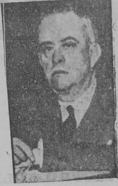
El nuevo ministro de Hacienda, don Antonio Lara

veces. No obstante es original de Keyserling el esteticismo con que ofrece las cuestiones atávicas y la previsión del porvenir. Muchas verdades que comparto; muchas aserciones fundamentales que no prueba, ni apruebo; muchos argumentos expositivos apoyados en ésta y, sobre todo ello, un profundo conocimiento del contenido y de las promesas vitales de la raza española, que la colocan en un plano privilegiado entre las razas dominadoras del porvenir.