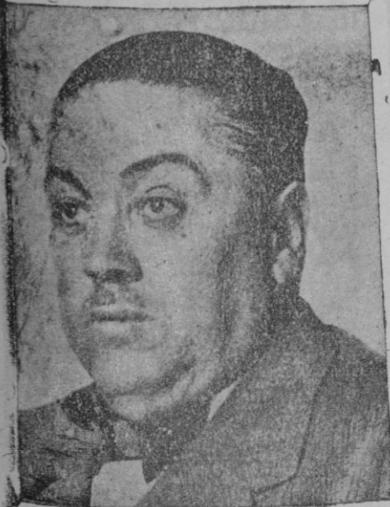
El nuevo Ministro de Gobernación, Sr. Martínez Barrios