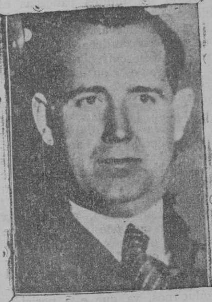
El nuevo ministro de Agricultura, don Ramón Feced