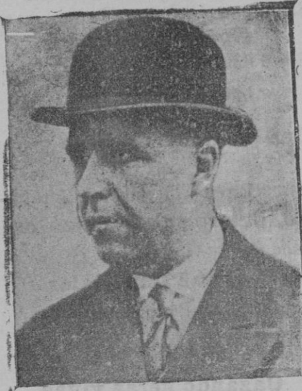
El nuevo ministro de la Guerra, Sr. Rocha

Libro evolucionista, en que se entremezclan y confunden muchas veces el "interior a mí" y el "exterior en mí", tiene más de platonismo que de otra cosa. No obstante constituye esta nueva obra de Keyserling un atrevido alarde de previsión, alcanzando más o menos fantásticamente, un posible destino histórico de las razas españolas. En una palabra: entiendo que esta nueva obra del Filósofo de Darmstadt se resuelve en último término, teóricamente, en una meditación en que lo platónico armoniza con lo pragmático, aun a expensas de la imaginativa; prácticamente en un subjetivismo transcendental afinadísimo y sutil. El fino estudio de la reptilización humana—no completamente original—, el símbolo primordial del anfibio y de la serpiente, la "procreación efervescente de la sangre fría...", todo ello es sonoro, es bello, es sugestivo y aun muy filosófico, si bien demasiado poético muchas