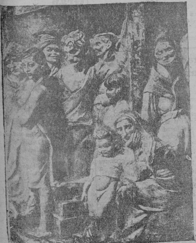
La madre con el niño, uno de los más bellos grupos que destacan su serenidad clásica en el "Retablo del Mar", tan elogiado por la crítica

campanas, de castas y de tradiciones! Los que teníamos entonces diez años, los que preferimos siempre la gasa cándida del rebocillo que aureolaba la cabeza de las pajesas ingenuas que decían "su merced", al caso de corcho colonial de los ingleses, recordamos con melancolía aquellas áureas murallas que defendían a Mallorca de la invasión extranjera, que la impedían perder su carácter maravilloso y convertirse en una colonia de periódicos ingleses, pijamas y mallots. He de confesarlo con sinceridad, aunque esto haga sonreír con ironía a los dueños de pensiones y de balnearios, prefería el canto de la lechuza al anidar en el destartado bastión a la música frita en los altavoces, de las radio-gramolas; prefería el paisaje abandonado y lujuriante, prefería los pinos aureolados de sol a los