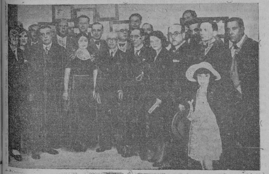
Autoridades y artistas que asistieron al festival Chopin en Valldemosa. Entre ellos figura el gran compositor Manuel de Falla.