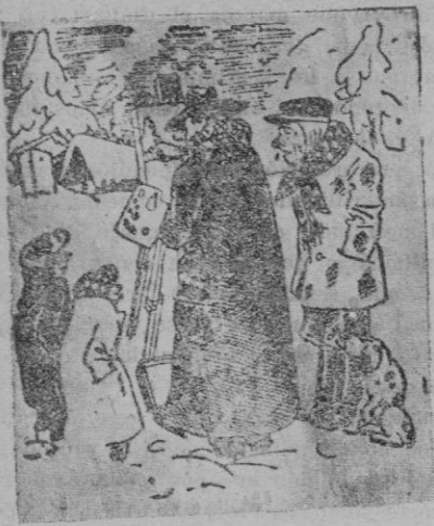
El aldeano (al pintor que está copiando su casa).—¿No podría usted poner el día de la Exposición un letrero diciendo: "Se alquila en el verano"?