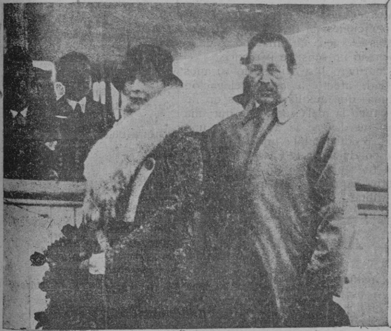
El eminente escritor alemán Emil Ludwig, a su llegada a Barcelona, acompañado de su esposa

El mismo señor Crespi encareció—a propósito de este asunto—la necesidad de que la Diputación preste atención y decidido apoyo a todo cuanto se re-